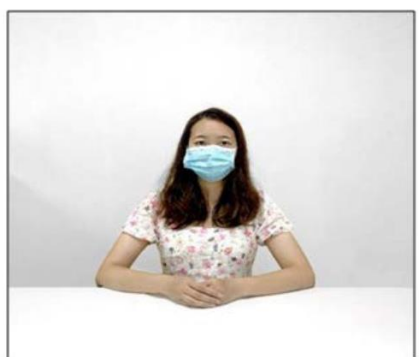
图2：正前方第一机位效果图